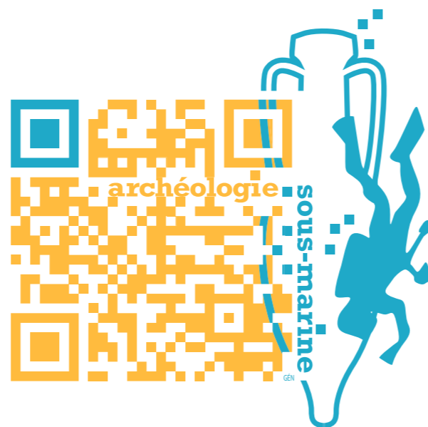
Ce QR code représente le département de l'archéologie sous marine.