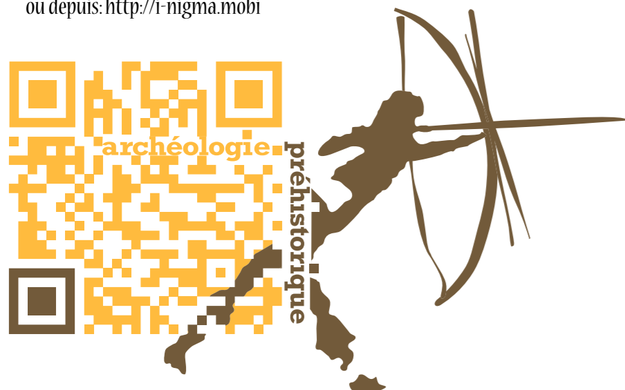
Ce QR code représente le département de l'archéologie préhistorique.

Pour flasher le code QR il suffit de télécharger GRATUITEMENT l'application I-nigma sur AppStore & Android Market ou depuis: http://i-nigma.mobi